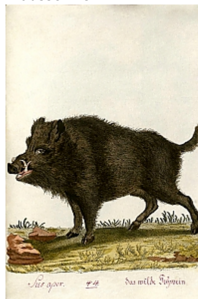
Wildschwein ( sus scrofa scrofa )