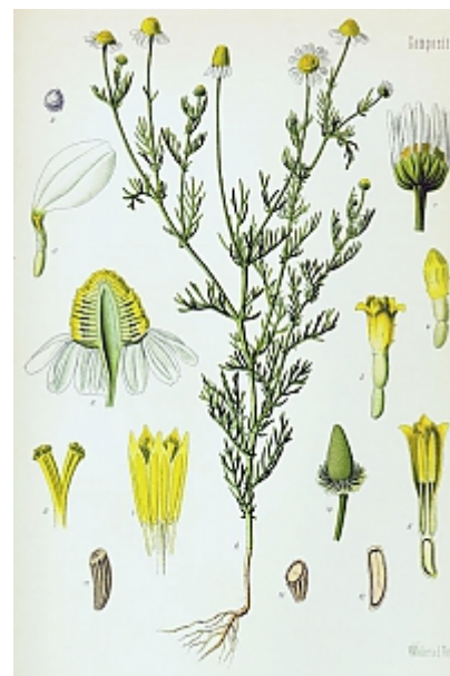
matricaria chamomilla L.

Die getrockneten Blüten der Kamille werden vor allem für Tee und Extrakte verwendet. Diese können zur äußerlichen Anwendung, zum Beispiel bei kleineren Wunden im Mund, Rachen oder