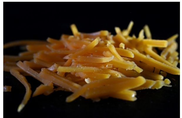
Cheddar Käse, in Streifen geschnitten